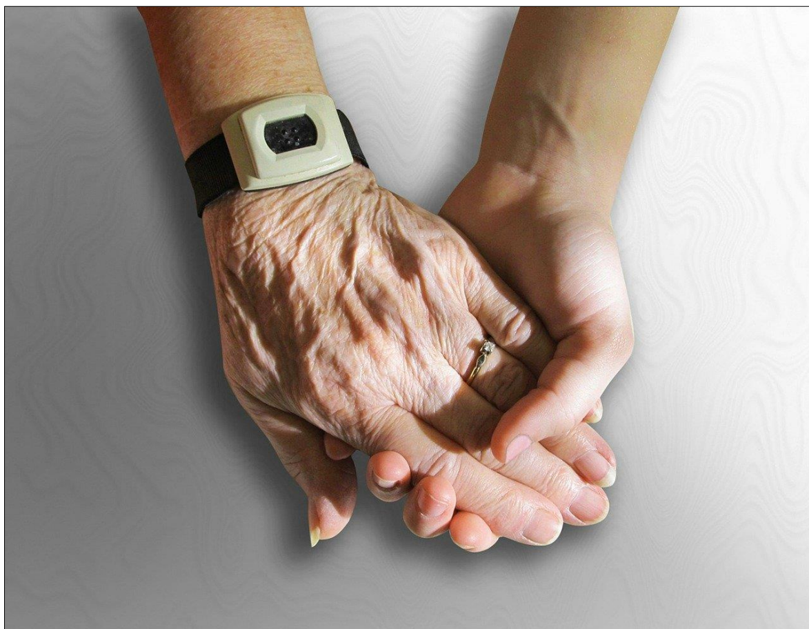
Table autonome des aînés des Collines (TAAC)

La TAAC tiendra deux activités pour les proches aidants des aînés au cours du mois de juin :